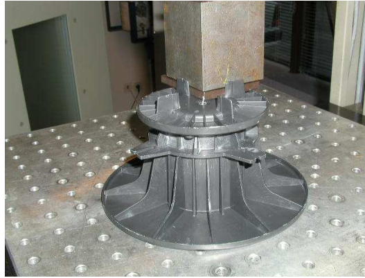
Montage de compression