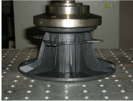
Montage de compression