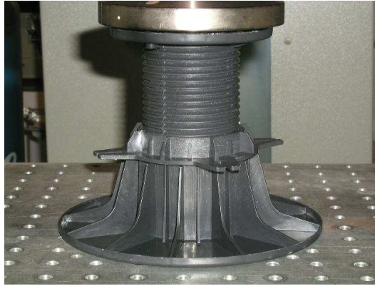
Montage de compression